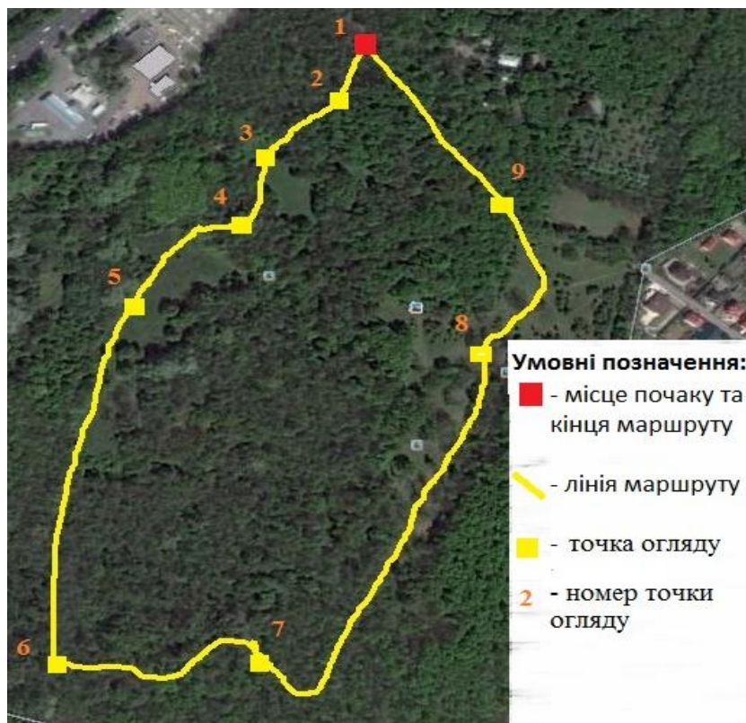
Рис.1. Схема маршруту екологічної стежки «Intermezzo»

масиві. Черешня є гарно квітуче, цінне дерево, яке в Україні поширене переважно в західних регіонах, включаючи Карпати. Ці дерева в Теремківському лісі мають добру життєву форму, окремі дерева досягають висоти 25 м, квітують, плодоносять. Смачні плоди черешні, що знаходяться у високій кроні дерева, ласують ними переважно птахи.